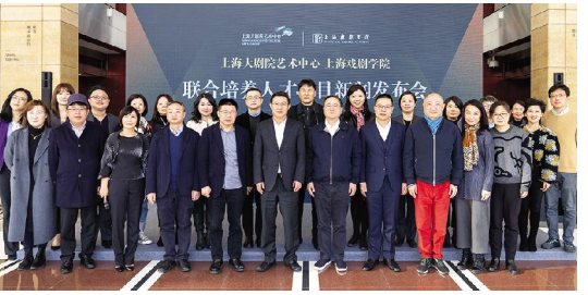
上海戏剧学院与上海大剧院联合培养人才项目签约仪式

【本報訊 12月23日, 上海戏剧学院与上海大剧院联合培养人才项目合作协议签约仪式在上海大剧院举行。双方将依托各自优势资源, 以产学研融合模式重点培养歌剧制作和舞台技术方面的专业人才, 为上海大剧院艺术中心及未来上海大剧院歌剧制作及技术人员队伍。